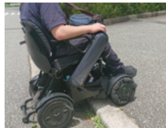
自宅周辺は段差や坂道が多い