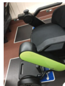
新幹線の座席横スペースにWHILLを保管