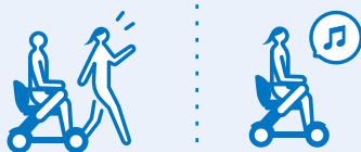
奥様も移動手段としてWHILLを使用

夫は大動脈乖離で倒れた後、リハビリを経て杖をつきながら少しの距離は歩けるようになりました。ただ、思うように体が動かさず悔しさを感じていたようです。仕事は私やスタッフに任せていたものの、やりたいこと、やるべきことが気になり、常に頭から離れなかつたみたいです。県外への出張や遠出の際は、私や友人が同行し、通常の子椅子を押したりしていたことも、夫は遠慮や外出への億劫さを感じていました。出かけない習慣がついてしまうことも心配でした。WHILLが来てからは、夫自身が自由に動き回ることができるようになり、職場でも自由自在に動いています。私自身も車椅子を押すことが大変で負担を感じていましたが、今ではお互い自分のペースで移動でき、お出かけ時は私が先に歩いたり、夫も気になるスポットがあれば勝手に止まったり、とかなりフリーです。(笑) 病気を発症してから初めて一人で新幹線に乗って東京まで行くなど、日々アクティブに動いている夫の姿を見ることができ嬉しいです。私自身もいわゆる移動する時の手段としてWHILLに時々乗っています。春になったらWHILLツーリングに出かけられるかも(笑)