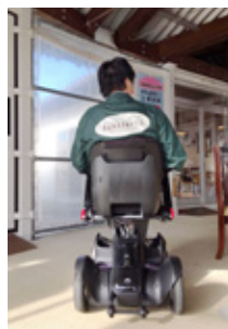
呼ばれたらパッと移動できる