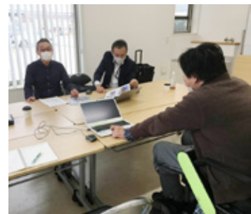
さっと移動ができるため、会議参加もスムーズ