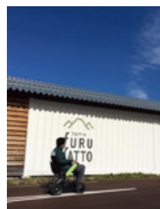
職場での移動にWHILLは欠かせない