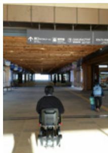
職場から上越妙高駅まで散歩