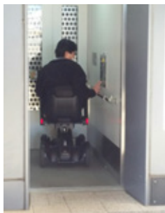
エレベーターにも一人で乗り込める