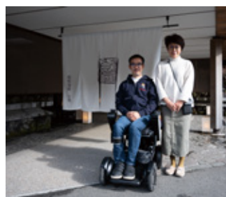
奥様と箱根旅行に