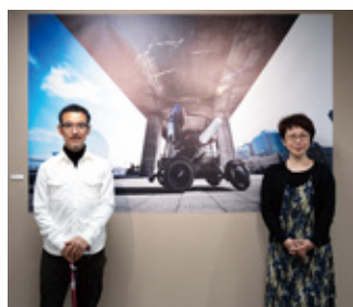
写真展ではWHILLを使った写真も展示