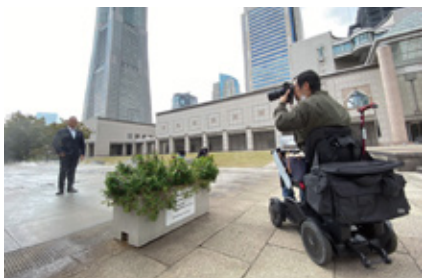
ロケ地での撮影の様子