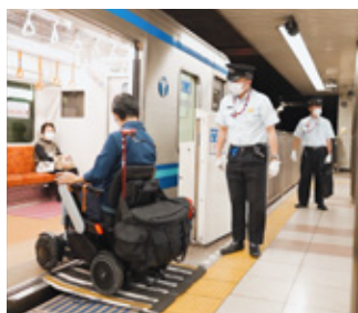
電車に乗り込む様子