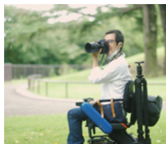
自然公園では野鳥の撮影も