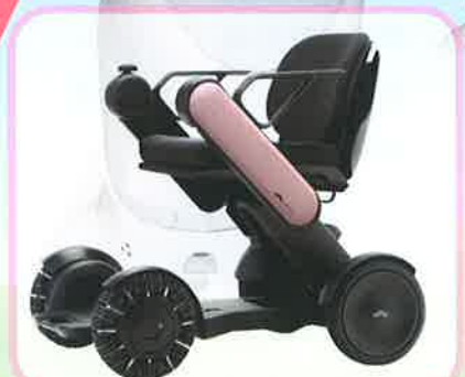
WHILL ModelC/WHILL 株式会社

総合リハビリテーションセンター 福祉のまちづくり研究所 (エントランスホール、中庭)