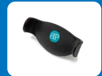
Typ Steuerknopf u-förmig

Komfort-Armauflage (kein medizinisches Produkt)