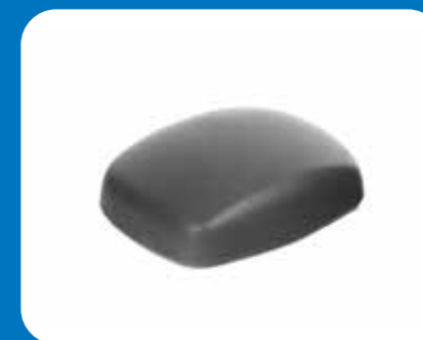
Type souris ordinateur