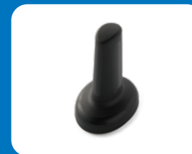
Type joystick bâton