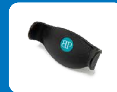
Type joystick forme U

Repose bras confort (dispositif non médical)