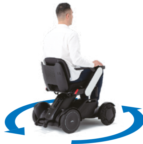
Draaicirkel van 76 cm De WHILL is gemakkelijk te besturen en kan door smalle doorgangen rijden, waardoor hij ideaal is voor gebruik in kleine binnenruimtes.