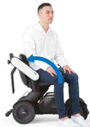
Opklapbare arMLEuning Til de arMLEuning op om gemakkelijk vanaf de zijkant in de stoel te gaan zitten. Ga op de voetsteun staan voor extra stabiliteit.