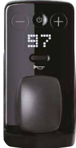
Moderne, intuïtieve controller Schakel de stroom in en regel de snelheid met één hand. De WHILL remt automatisch wanneer u de controller loslaat, zelfs op een helling. De controller kan zowel links als rechts op het voertuig worden aangebracht.